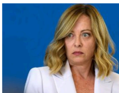
Italias statsminister Giorgia Meloni.

Meloni sier at hun vil donere pengene hun er tilkjent til vel-